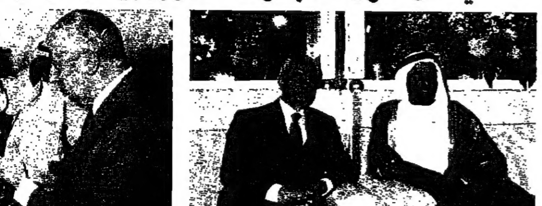
حوار بين الهاوي وامير البحرين

حجرة النفس تستطيع منع حجرة المال. نحن نخاطب أوصياء الحرب، ونعرض للحقل والوقائع، ولو كان الهدف السلاح للجيش اللبناني، لكن أوصياءنا وزير الدفاع ولجنة عسكرية من كبار الضباط للبحث في موضوع السلاح... الهدف اوسع واشمل واعمق واوسع... اجنبا - رئيس جمهورية ورئيس حكومة - لنقول للاشقاء العرب ان لبنان واحد ولتتحدث بلغة واحدة، ونطلق قضية واحدة، لبنان بحاجة الى المساعدة واخوانه في كل المجالات... نحن عرضنا وضعنا وعلمنا تقديرا المساعداة